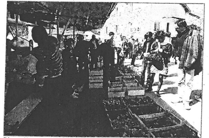
Plus d'une centaine d'exposants ont envahi les rues de Relanges sous un vrai soleil estival.